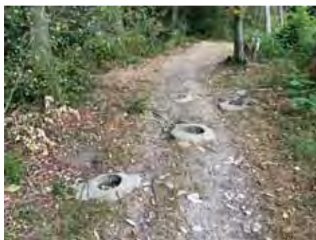
Panzersperren Foto: Hanspeter Meier

Titelseite Foto links: Vereidigung der Ortswehr Muttens, 1940 Museen Muttens Foto rechts: Bunker, Hanspeter Meier, 2022