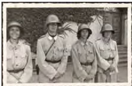
Luftschutzgruppe Flugzeugüberwachung 1943

Auf dem Rundgang kann das Innere eines Bunkers besichtigt werden. Wir servieren an diesem Standort einen Apéro. Dieser wird musikalisch von einem Waldhorn-Ensemble der Musikakademie Basel unter der Leitung von Stefan Ruf umrahmt.